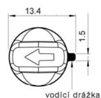
Čelní pohled na koncovku senzoru